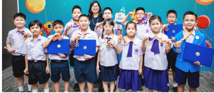
ตั้งเล็กแก๊งภัย ตัวดีดกับชาติ

คอร์สเรียนออนไลน์ เรียนรู้ได้แม้อยู่ที่บ้าน จากชายเอนเทีย